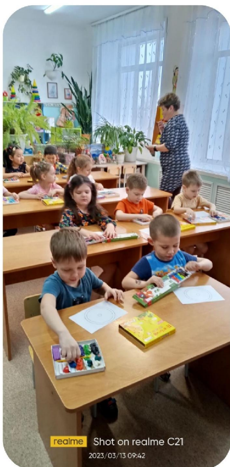
realme Shot on realme C21 2023/03/13 09:42