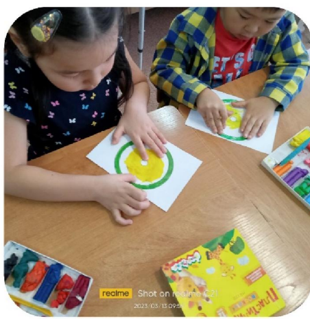
realme Shot on realme C21 2023/03/13 09:50