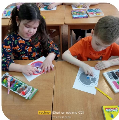
realme Shot on realme C21 2023/03/13 09:59