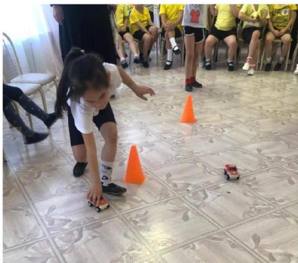
Проведение спортивного развлечения «Юные спасатели - 2022»