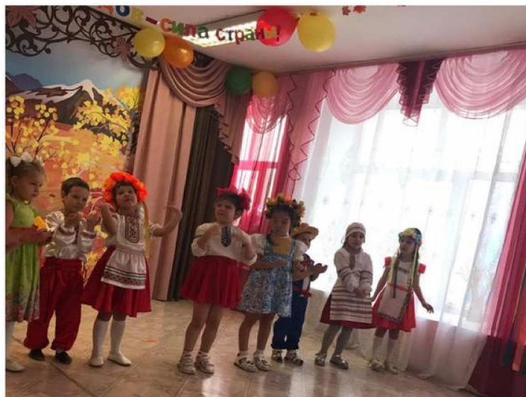
Проведение фестиваля в доу «Дружба народов – сила страны»